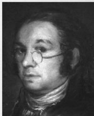
Hace 250 años, Goya era moderno. Fue un tipo innovador.

espíritu libre y un humanista – fue un tipo innovador. Un artista que acompañó la evolución de un mundo, que pasó de las monarquías a las nacientes democracias. Condenó la violencia en sus obras Los Desastres de la Guerra , exaltó la belleza con La Maja Vestida , y retrató las costumbres de su tiempo en La Vendimia .